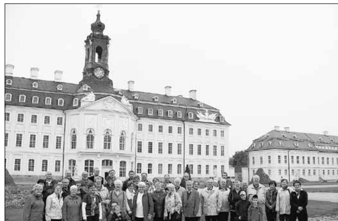
Die Gäste aus Gronau und Stockach mit den Wermsdorfer Gastgebern auf Schloß Hubertusburg