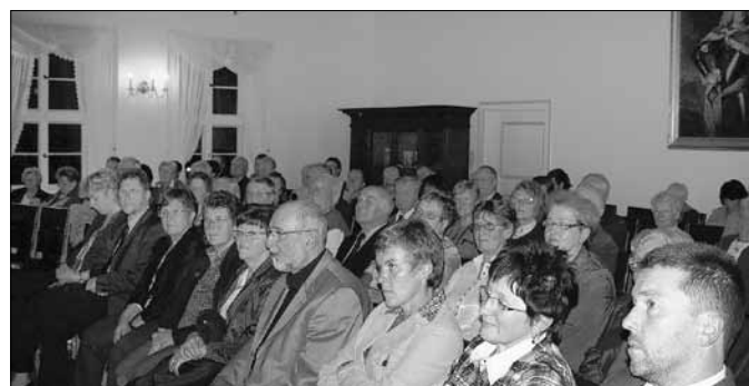
Festakt im Alten Jagdschloß