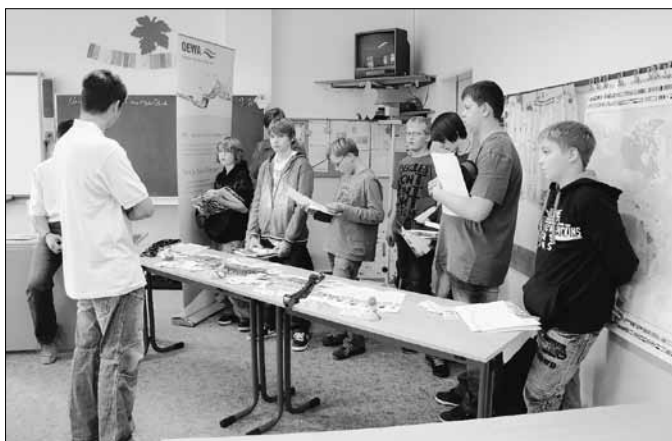
Projekttag zum Thema Afrika an der Mittelschule