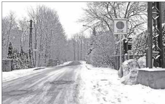
Zeichen 290.1., 290.2 wurde neu aufgestellt Straße: von Reckwitz Richtung Fasanenholz

Zeichen 290.1, 290.2 der StVO: Wer ein Fahrzeug führt, darf innerhalb der gekennzeichneten Zone nicht länger als drei Minuten halten, ausgenommen zum Ein- oder Aussteigen oder zum Be- oder Entladen.