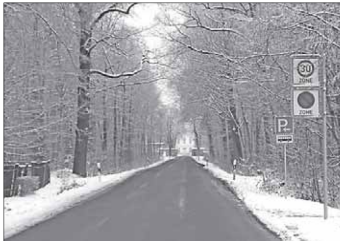
Zeichen 290.1, 290.2 wurde nur nach hinten versetzt Straße: von Tankstelle Richtung Hubertusburg

Seit dem 17. Januar 2014 wurde das Zonenhalteverbot Zeichen 290.1, 290.2 der StVO der Hubertusburger Straße erweitert.