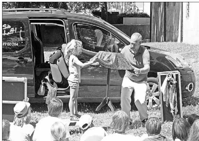
Als krönender Abschluss kam das Eisauto und überraschte die Kinder mit einer kühlen Erfrischung.

Anschließend ging es in den Schlosspark. Dort ließen sich die Kinder von einem Magier „verzaubern“ und wirkten selbst aktiv bei den Zaubertricks mit. Nach der Zauberschow konnten sich die kleinen Posthörnchen auf der Hüpfburg austoben und kleine Figuren oder Tiere aus Ballons modellieren lassen.