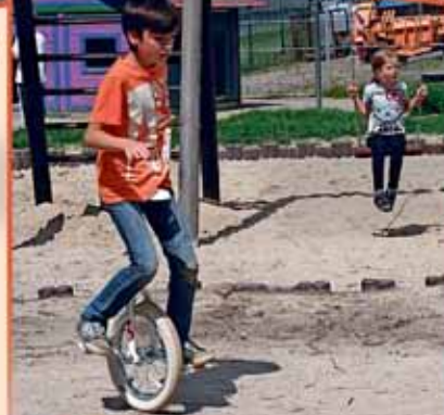
Fahrtraining mit dem Einrad