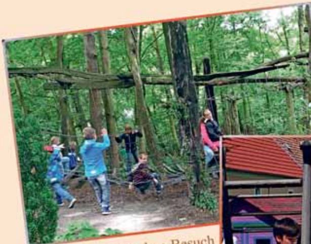
Kletterpause nach dem Besuch der Feengrotten in Saalfeld

Die Kinder des ASB-Hortes Posthörnchen genießen ihre Sommerferien