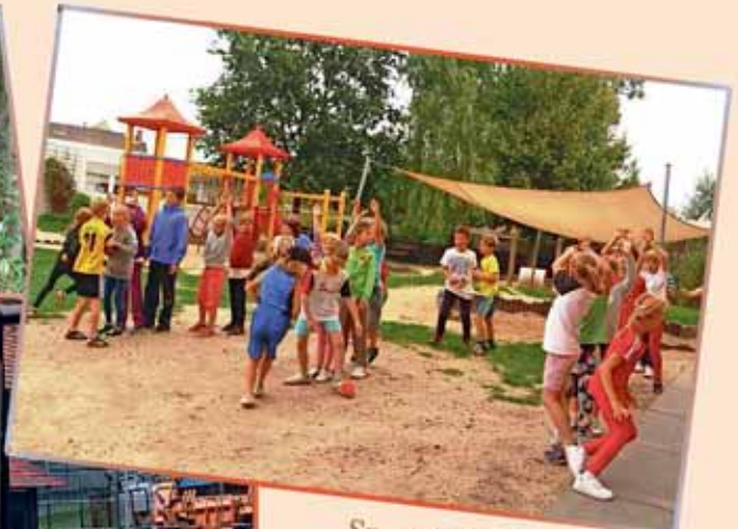
Sport & Spiel im Hort