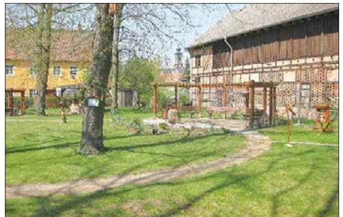
Foto: Fayence-Manufaktur Wernsdorf, ehemalige Trockenscheune und Wohnhaus

„Fayence“ - eine dem Porzellan ähnliche, aber preiswertere herstellbare Keramikware auf der Basis von Kaolin hatte ihre Hochzeit im 18. Jahrhundert. Eine der größten Manufakturen in Sachsen gab es auf dem Gelände des Schlosses Hubertusburg. Sie produzierte hier von 1770 bis 1848 und nutzte die Kaolinvorkommen zwischen Wernsdorf und Mügeln. Die Trockenscheune der Steingutfabrik und das Wohnhaus des Manufakturleiters sind bis heute erhalten geblieben.