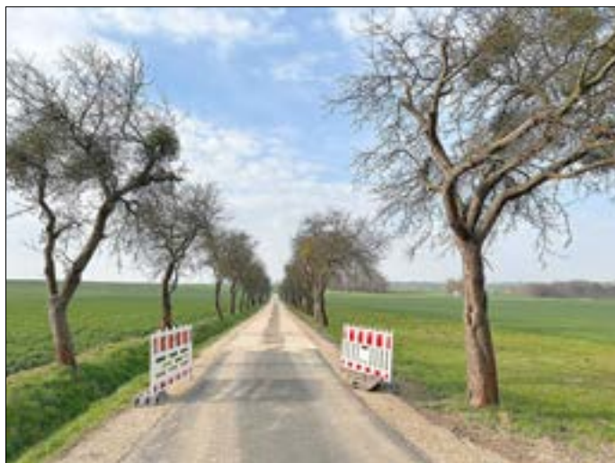
Wegebau „Gröppendorfer Delle“, Gemarkung Gröppendorf

Am 06.04.2023 erfolgte die Abnahme des Wirtschaftsweges „Gröppendorfer Delle“ in der Gemarkung Gröppendorf. Genutzt werden kann der Wirtschaftsweg für den Landwirtschaftsverkehr für Radfahrer und natürlich Spaziergänger. Der Weg wurde auf einer Länge von ca. 1.800 m grundhaft ausgebaut und mit Wirtschaftswegepflaster aus Beton befestigt. Er verbindet den Ortsteil Gröppendorf mit der Staatsstraße S 41.