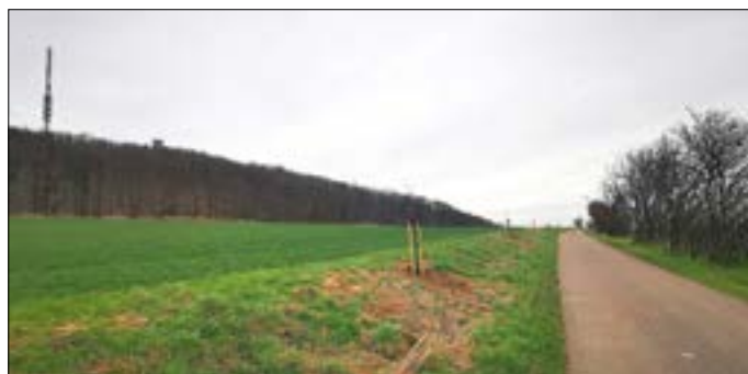
Neu gepflanzte Bäume an der Trift, der Altbestand wurde Pflegemaßnahmen unterzogen

Somit bietet sich bald für Wanderer und Radfahrer nicht nur ein schönes Bild, sondern wir unterstützen damit aktiv den Klimaschutz.