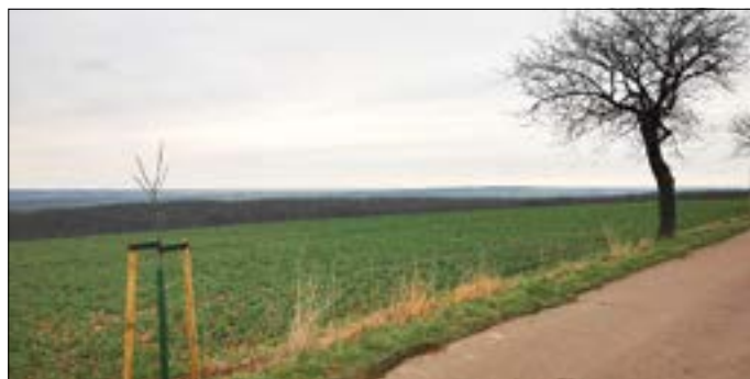
Pflanzung zwischen Altbestand am Oberweg