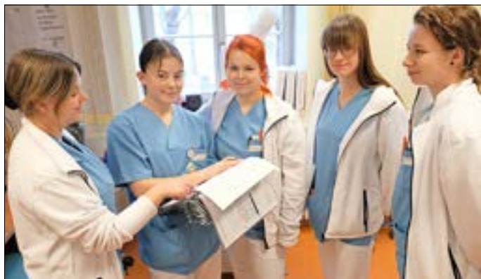
Dienstübergabe der Azubis in der Klinik für Neurologie und neurologische Intensivmedizin

Die Auswertung unseres 1. Projektes dieser Art haben wir in Form von Fragebögen und Feedbackgesprächen durchgeführt. Insgesamt wurde das Projekt als gute Vorbereitungsphase für die Prüfungen bewertet. Die Azubis fühlten sich in ihren Rollen gefestigt, waren stolz und stellten für sich ihren noch bestehenden Lernbedarf fest. Auch für die kommenden Projektstage „Azubis leiten eine Station“ gab es konstruktive Kritik und Hinweise zu Vorbereitung und Gestaltung, welche wir als Praxisanleiterteam erst nehmen und beim nächsten Mal verbessern werden.