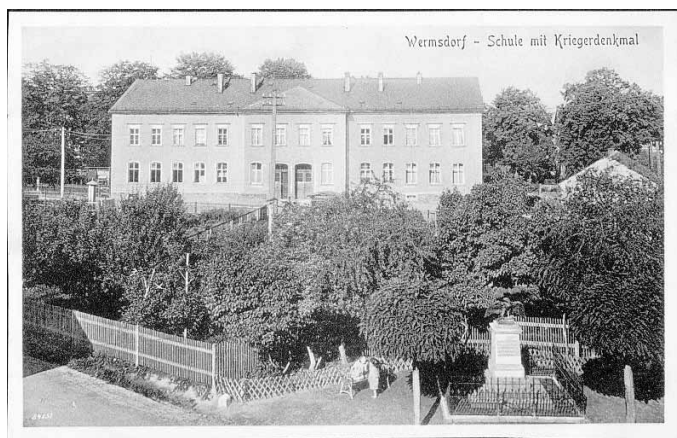
Foto: Schule mit Denkmal.

Eine weitere kleine Villa im Jugendstil befindet sich in der Schulstraße. An deren Ende befindet sich auf dem Gelände der Hubertusburg das sogenannte „Benjamin-Haus“.