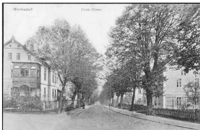
Foto: Schlossstraße-Palais-Straße. Ansichtskarte von 1911, Verlag Robert Seibod

Gegenüber steht ein kleines schön anzusehendes Gärtnerhäuschen im Fachwerkstil.